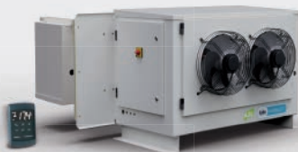
COMPACTO MAXI-BLOCK DE PARED MAXI-BLOCK WALL-MOUNTED COMPACTS DE PAROI MAXI-BLOCK UMB