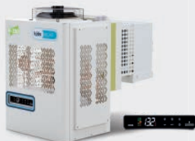
COMPACTO COMERCIAL DE PARED COMPACT WALL-MOUNTED COMPACT DE PAROI EMB