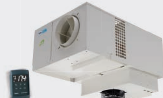
COMPACTO COMERCIAL CENTRÍFUGO DE TECHO COMMERCIAL CEILING MOUNTED CENTRIFUGAL COMPACT COMMERCIAL CENTRIFUGE DE PLAFOND EMF