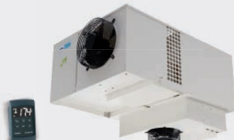
COMPACTO COMERCIAL DE TECHO COMPACT CEILING-MOUNTED COMPACT COMMERCIAUX DE PLAFOND EMR