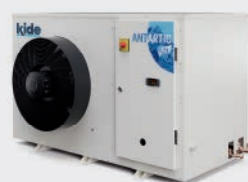
UNIDADES CONDENSADORAS CON CAPACIDAD FRIGORÍFICA VARIABLE CONDENSING UNITS WITH VARIABLE REFRIGERATION CAPACITY GROUPE DE CONDENSATION À PUISSANCE FRIGORIFIQUE VARIABLE ANTARTIC