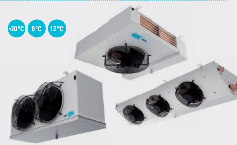
EVAPORADORES EVAPORATORS ÉVAPORATEURS