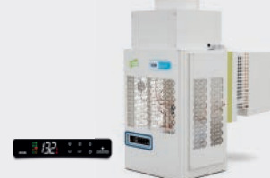
COMPACTO COMERCIAL DE PARED CENTRÍFUGO COMMERCIAL WALL MOUNTED CENTRIFUGA COMPACT COMMERCIAL DE PAROI CENTRIFUGE EMC