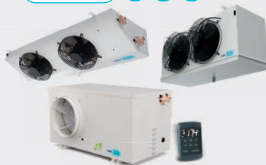
PARTIDO COMERCIAL CENTRÍFUGO COMMERCIAL CENTRIFUGAL SPLIT SPLIT CENTRIFUGE COMMERCIAL ESF