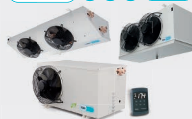
PARTIDO COMERCIAL SILENCIOSO COMMERCIAL SILENT SPLIT SPLIT SILENCIEUX COMMERCIAUX ESS