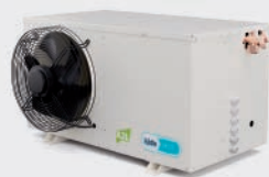
UNIDADES CONDENSADORAS SILENCIOSAS SILENT CONDENSING UNITS GROUPE DE CONDENSATION SILENCIEUX ECI