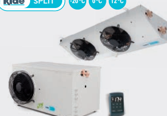
PARTIDO COMERCIAL SPLIT COMMERCIAL SPLIT SPLIT COMMERCIAL ESC