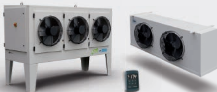
PARTIDO MAXISPLIT MAXISPLIT MAXISPLIT USC