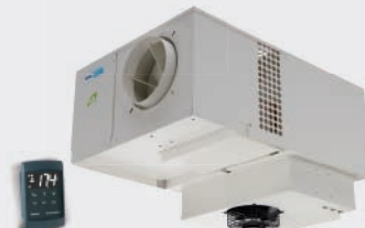
COMPACTO COMERCIAL CENTRÍFUGO DE TECHO COMMERCIAL CEILING MOUNTED CENTRIFUGAL COMPACT COMMERCIAL CENTRIFUGE DE PLAFOND EMF