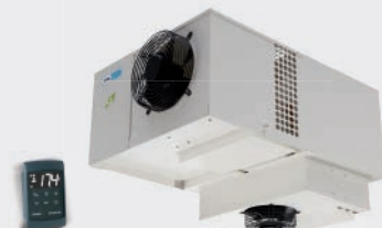
COMPACTO COMERCIAL DE TECHO COMPACT CEILING-MOUNTED COMPACT COMMERCIAL DE PLAFOND EMR